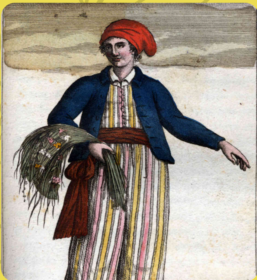
Portrait de Jeanne Barret par Cristoforo Dall'Acqua

Déguisée en homme pour embarquer en 1766 dans l'expédition de Bougainville, Jeanne Barret est la première femme connue à accomplir un tour du monde. Assistante et compagne du naturaliste Philibert Commerson, elle joue un rôle essentiel dans la collecte, le classement et la mise en herbier de centaines de plantes exotiques.