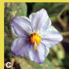
Solanum Baretiae- Tepe E, Ridley G, Bohs L (2012)